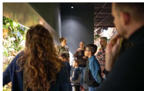
Octobre 2023 – Visite guidée au Muséum d'Histoire Naturelle de Genève