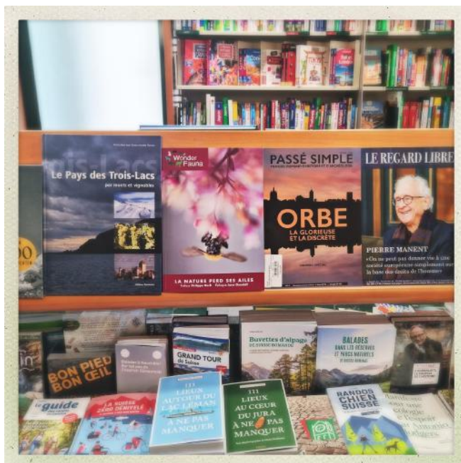
La revue Wonder Fauna exposée dans la librairie Payot de Neuchâtel, mai 2023

Le 17 octobre 2023, l'Association WonderFauna a tenu un stand lors de la Fête du Bioparc. La revue a également été présentée à cette occasion.