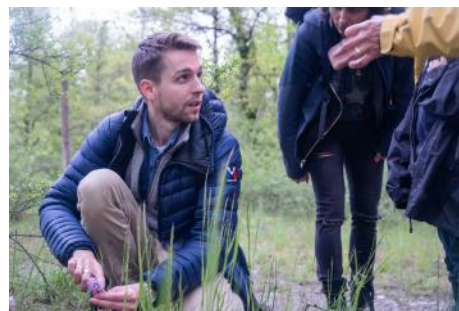
Avril 2023 – Sortie dans la Réserve Naturelle du Moulin de Vert à Cartigny.

Nous tenons à témoigner notre gratitude au Jardin botanique de Genève, au Musée d'histoire naturelle de Genève, au Bioparc Genève, à l'organisation Animuse pour la collaboration. Un grand MERCI à l'association S5 qui a permis à ce projet de voir le jour. Nous remercions chaleureusement également la Fondation Max Bircher et la Fondation Culturelle des Sourds pour leur précieux soutien.