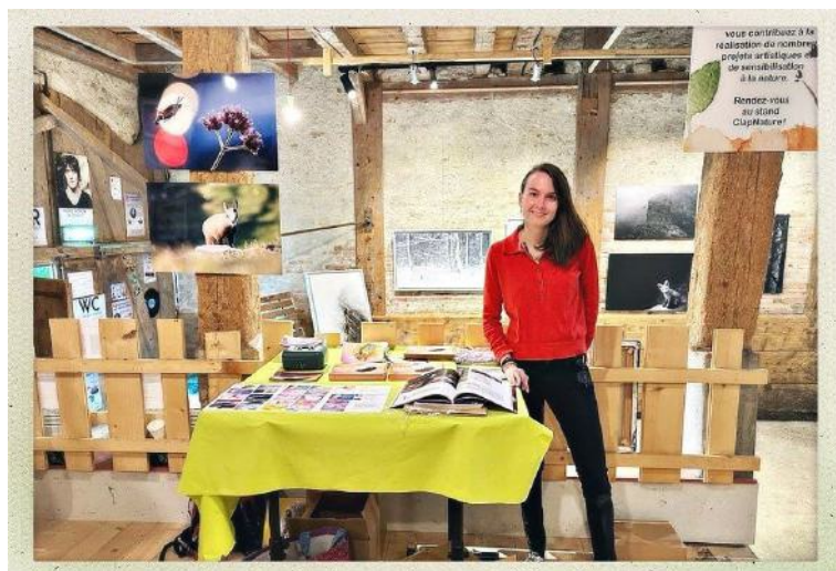
Exposition dans le cadre de la Fête du Solstice de l'Association Clap Nature, à Onnens, juin 2023